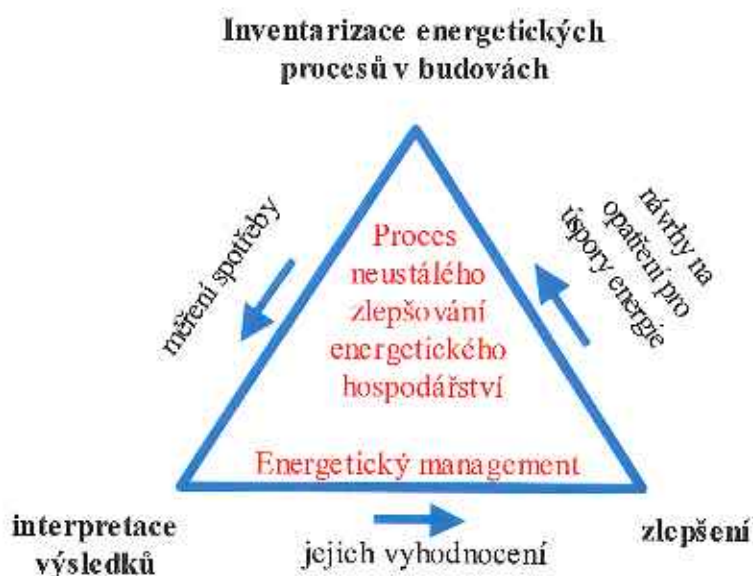
Obrázek 3 – Princip neustálého zlepšování energetického hospodářství

Jedná se o uzavřený cyklický proces neustálého zlepšování energetického hospodářství v budovách, který se skládá z následujících činností: měření spotřeby energie – stanovení potenciálu úspor energie – realizace opatření – vyhodnocení a porovnání velikosti úspor předpokládaných a skutečně dosažených.