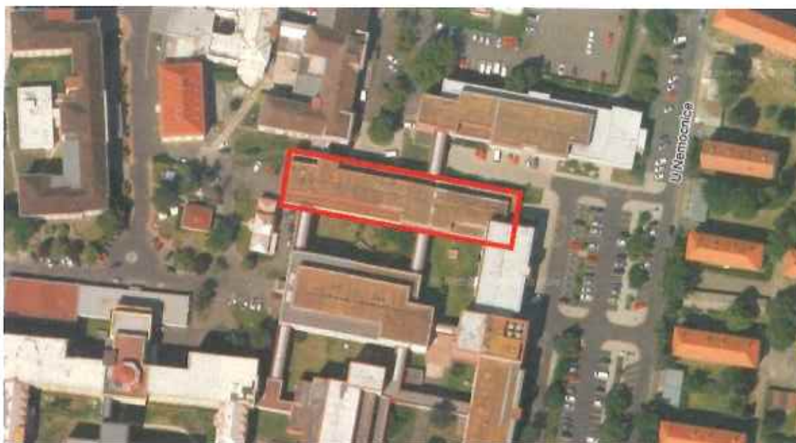
Obrázek 1 – Satelitní snímek posuzovaného objektu